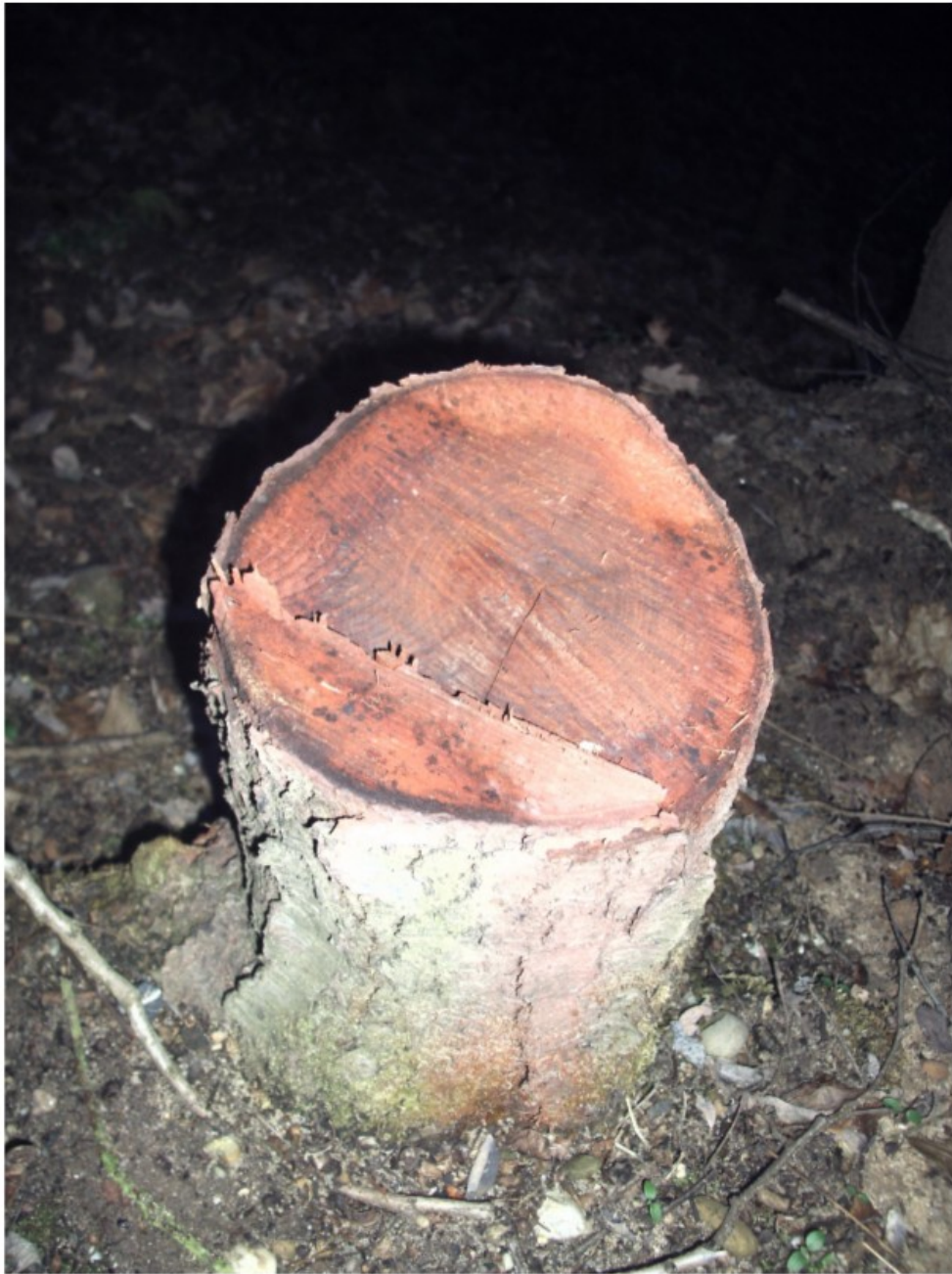
Uncropped copy of the "glyphosate stump" depicted in the abstract