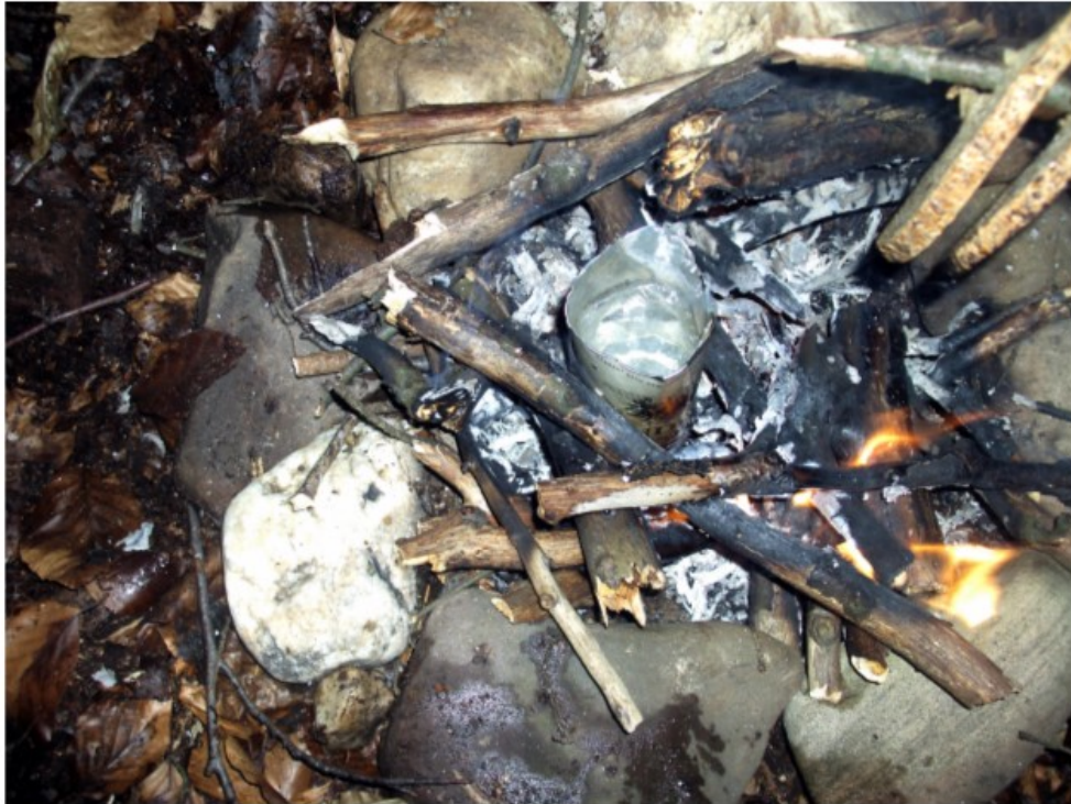
Surplus impression from my visit to Kelsterbacher Wald